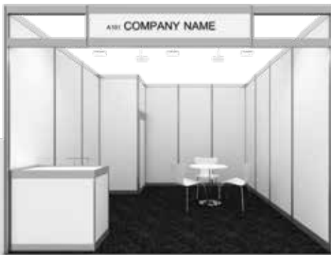
Ejemplo Stand Pack STANDARD 1 cara abierta / Example Stand Pack Standard 1 open side

Le recordamos que toda decoración/vinilos de contratación ajena a los proveedores oficiales de Fira Barcelona que se haya usado en la estructura del stand debe quedar retirada al finalizarse la feria. En caso contrario, el expositor será facturado por el trabajo de retirada. Se pueden efectuar cambios de estructura hasta 48 h antes de que empiece el montaje oficial. Please remember that all decoration/graphics used in the stand's structure and not ordered through Fira Barcelona's official suppliers must be removed at the end of the show. Otherwise the exhibitor will be billed for the cost of removing it/them. Structure changes can be made up to 48 hours before official assembly begins.