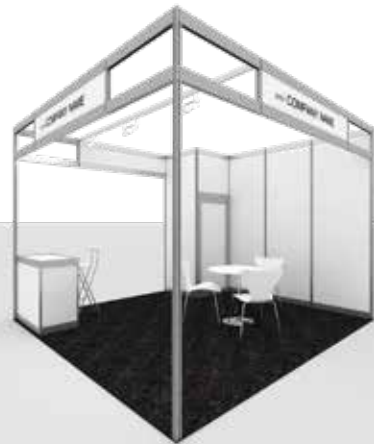
Ejemplo Stand Pack STANDARD 3 caras abiertas / Example Stand Pack Standard 3 open sides

La cantidad de caras abiertas del stand dependerá de su ubicación. / The number of open sides of the booth will depend on its location.